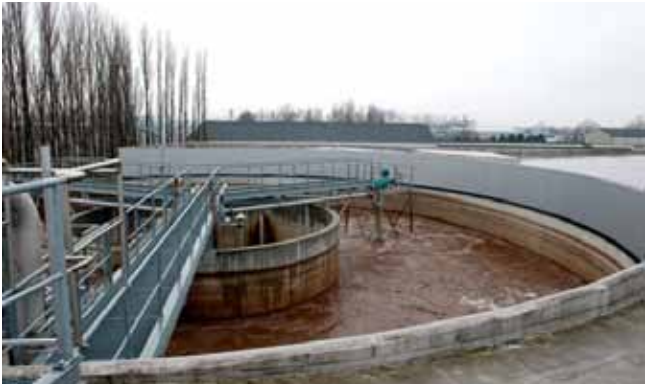
Bijzonder aan het 'Blue Hero'-concept is dat de 'effluenttank' van het biologische zuiveringsstelsel wordt gebruikt.