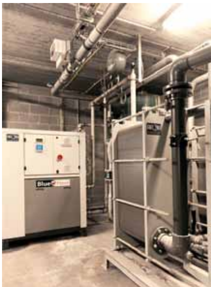
Dankzij 'Blue Hero' kan Nollens 47.500 euro per jaar aan stookkosten besparen.